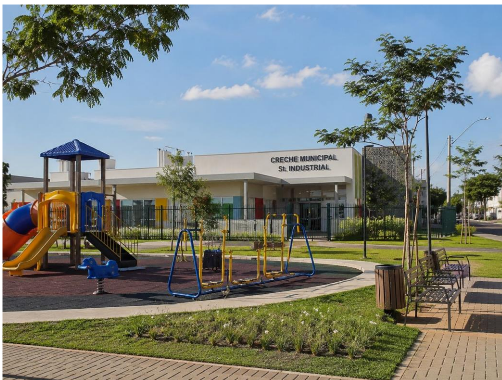
Modelagem ilustrativa virtual gerada com auxílio de ferramenta de IA generativa.