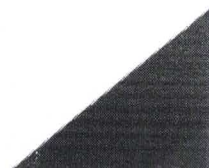
Hugo Sergio Batista Prefeito Municipal