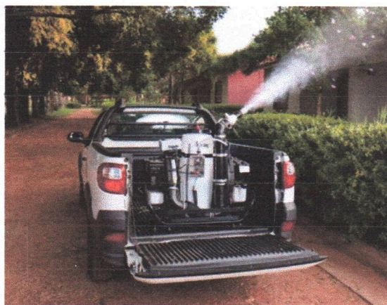
Figura 2. Mini Gerador de Aerosol UBV Acoplado ao Veículo